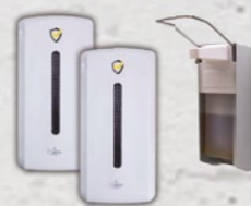
(AUTOMATISCHE) DISPENSERS grote voorraad!