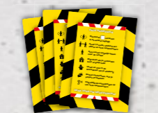
HUISREGELBORDEN ook maatwerk mogelijk