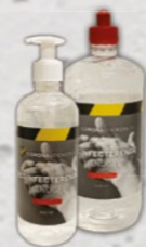
DESINFECTERENDE HANDGEL als navul of pompje